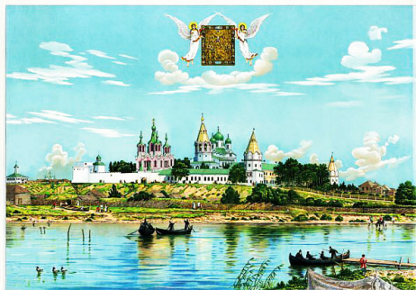
ДАЛМАТОВСКИЙ УСПЕНСКИЙ МОНАСТЫРЬ, ПЕРМСКОЕ ГУБЕРНИИ.

Далматовский Успенский монастырь – православный мужской монастырь, расположен на левом берегу реки Исети, при впадении в нее р. Течи. Ансамбль Далматовского монастыря и входящие в него строения – Успенский собор, церковь Всех Скорбящих Радость, крепостные стены, монастырские кельи - являются объектами культурного наследия РФ федерального значения.